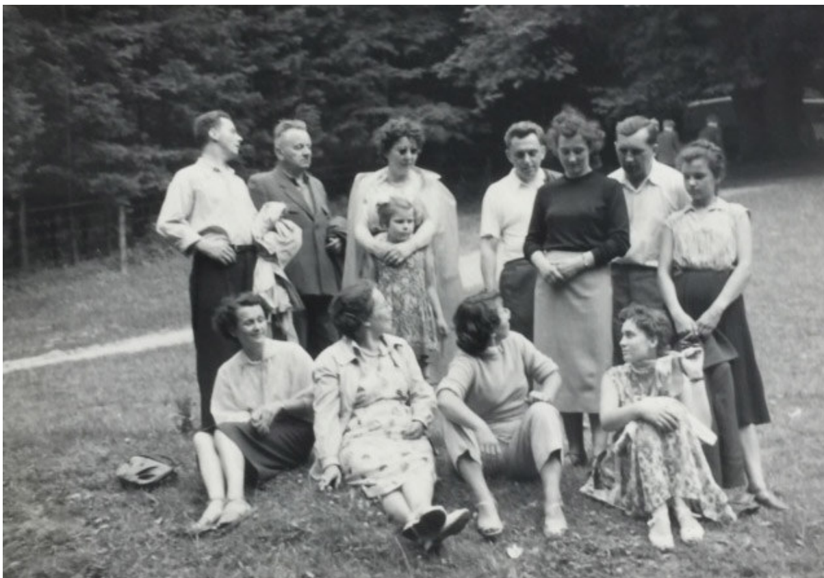
Wycieczka gości weselnych