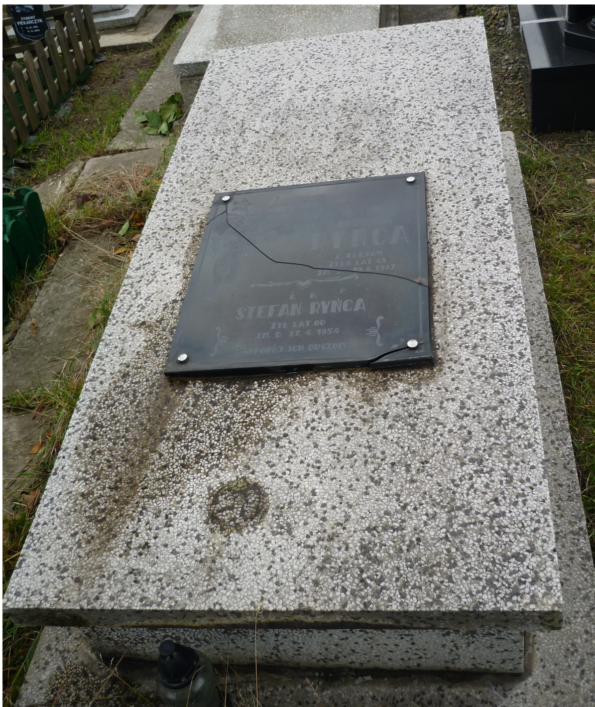
Grób rodziców Wł. Ryńcy na cmentarzu w Sosnowcu-Zagórzu (zdjęcie z listopada 2017 r.)