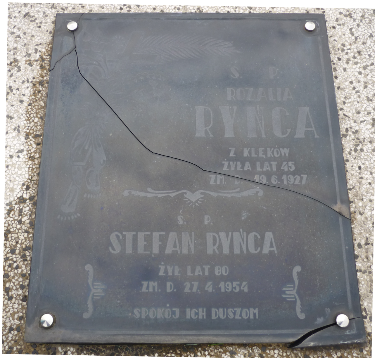
Grób rodziców Wł. Ryńcy na cmentarzu w Sosnowcu-Zagórz - zbliżenie (zdjęcie z listopada 2017 r.)